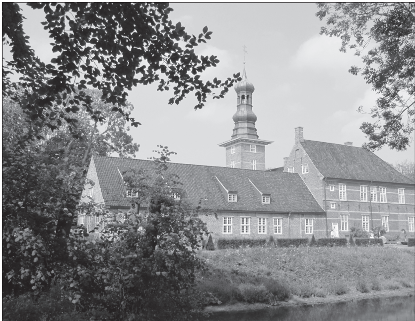
Schloss vor Husum